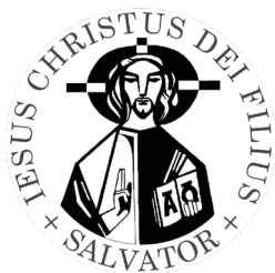
Gesellschaft des Göttlichen Heilandes